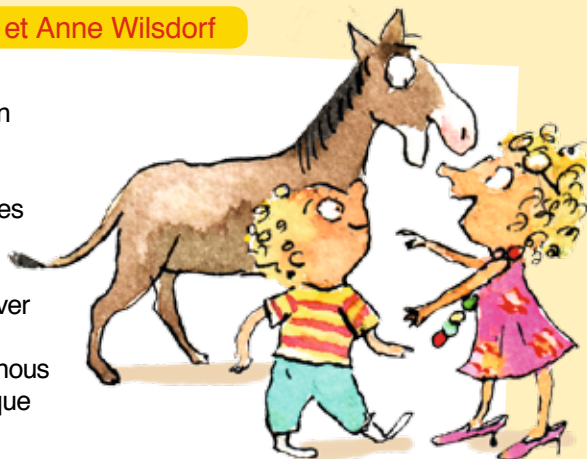
Illustrations : Anne Wilsdorf.