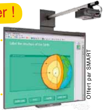
Offert par SMART

Un tableau numérique interactif SMART pour la classe. La rédaction de Belles Histoires et Anne Wildorf viendront remettre le prix et offriront à chaque élève un exemplaire de Belles Histoires « Bon à rien ! ».