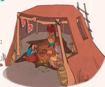
Chez les Mandans

FAUX Seules les tribus des plaines, nomades, vivent dans des tipis. Chez les tribus sédentaires, celles qui restent au même endroit, les habitations ont des formes variées : dômes, rectangles... Les Séminoles, en Floride, vivent dans des huttes sur pilotis. Les Hopis, en Arizona, construisent des maisons à étages en boue séchée, reliées entre elles par des échelles !