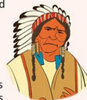
Sitting Bull (1831-1890)

VRAI Des chefs indiens comme Cochise, Geronimo, Crazy Horse ou Sitting Bull résistent contre l'armée américaine le plus longtemps possible. Mais en 1890, après un horrible massacre à Wounded Knee, les Lakotas rendent les armes. C'était l'une des dernières tribus encore libres. La plupart des autres étaient déjà confinés dans des réserves.