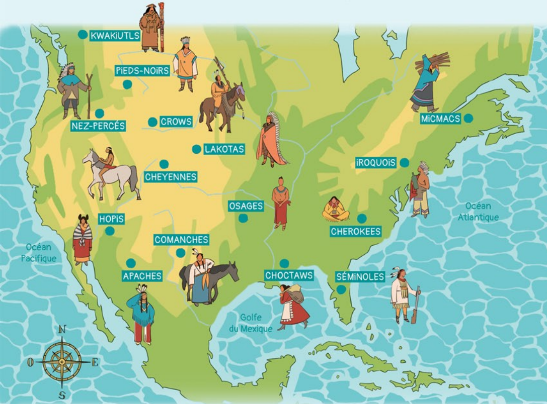
Des centaines de tribus ont vécu en Amérique du Nord. Cette carte t'en montre quelques-unes.