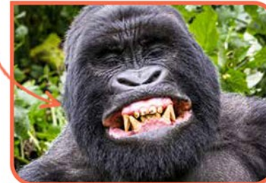
Texte : Pauline Poyen. Illustration : Walter Glassof.

Le gorille possède des canines pointues et impressionnantes qui mesurent 5 centimètres.